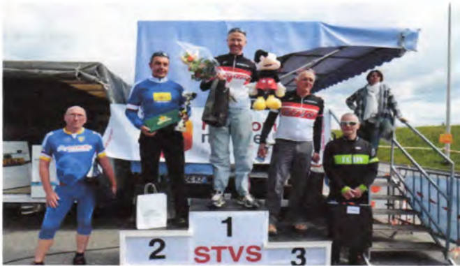
Le podium de la catégorie "Grands sportifs".

Plus de 130 concurrents ont participé aux différentes épreuves le lundi 6 avril.