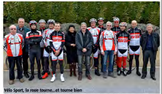
Vélo Sport, la roue tourne...et tourne bien

Pour 2014 le programme est bien rempli avec entre autres le Championnat départemental le 04/05, le