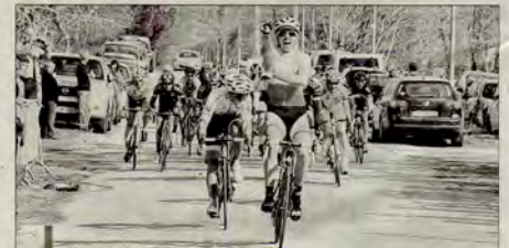
Sur la brèche depuis février, le STVS a déjà remporté 14 victoires et 22 podiums sur les 17 courses disputées.

Si les individualités de l'équipe sont une force redoutable, la cohésion et l'esprit collectif donnent à Sainte-Tulle une arme supplémentaire pour écraser certaines épreuves. Le week-end dernier à Richerenche